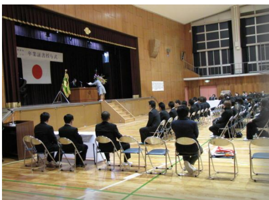
【感動の卒業式 4年間みんなよくがんばりました】