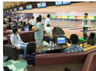
【ボウリング大会のひとこま】